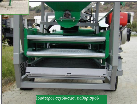
Ιδιαίτεροι σχεδιασμοί καθαρισμού