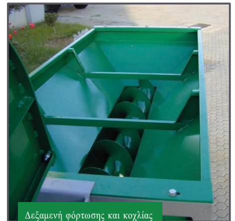
Δεξαμενή φόρτωσης και κοχλίας