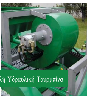
Διπλή Υδραυλική Τουρμπίνα